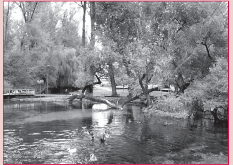
Οι πηγές της Αγ. Βαρβάρας στο κέντρο της πόλης.