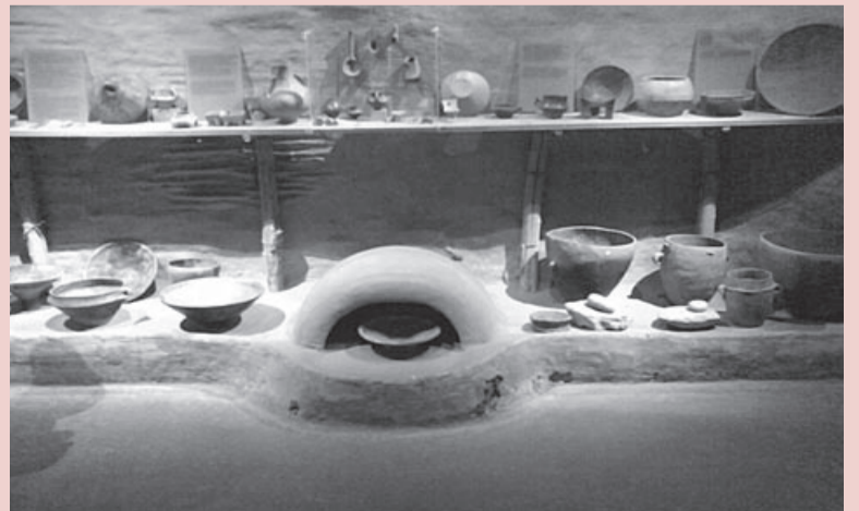
Φωτό από το εσωτερικό του Αρχ. Μουσείου Δράμας.

Χωρίς καμία δόση υπερβολής είναι αλήθεια ότι τη Δράμα λίγο την είδαμε, πολύ όμως την αγαπήσαμε. Συνιστούμε ανεπιφύλακτα σε όποιον σχεδιάζει μικρές αποδράσεις από το αποπνικτικό κλίμα των μεγαλουπόλεων, να την επισκεφθεί και αυτή και τα περίχωρά της.